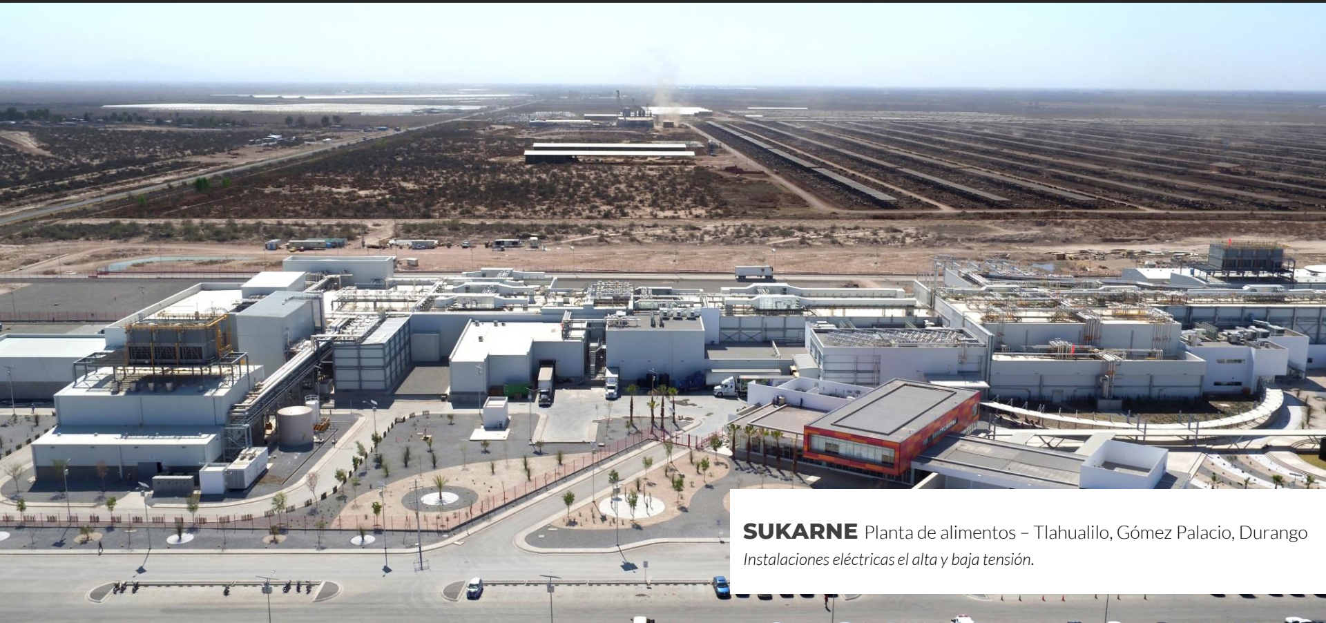
SUKARNE Planta de alimentos – Tlahualilo, Gómez Palacio, Durango Instalaciones eléctricas el alta y baja tensión.