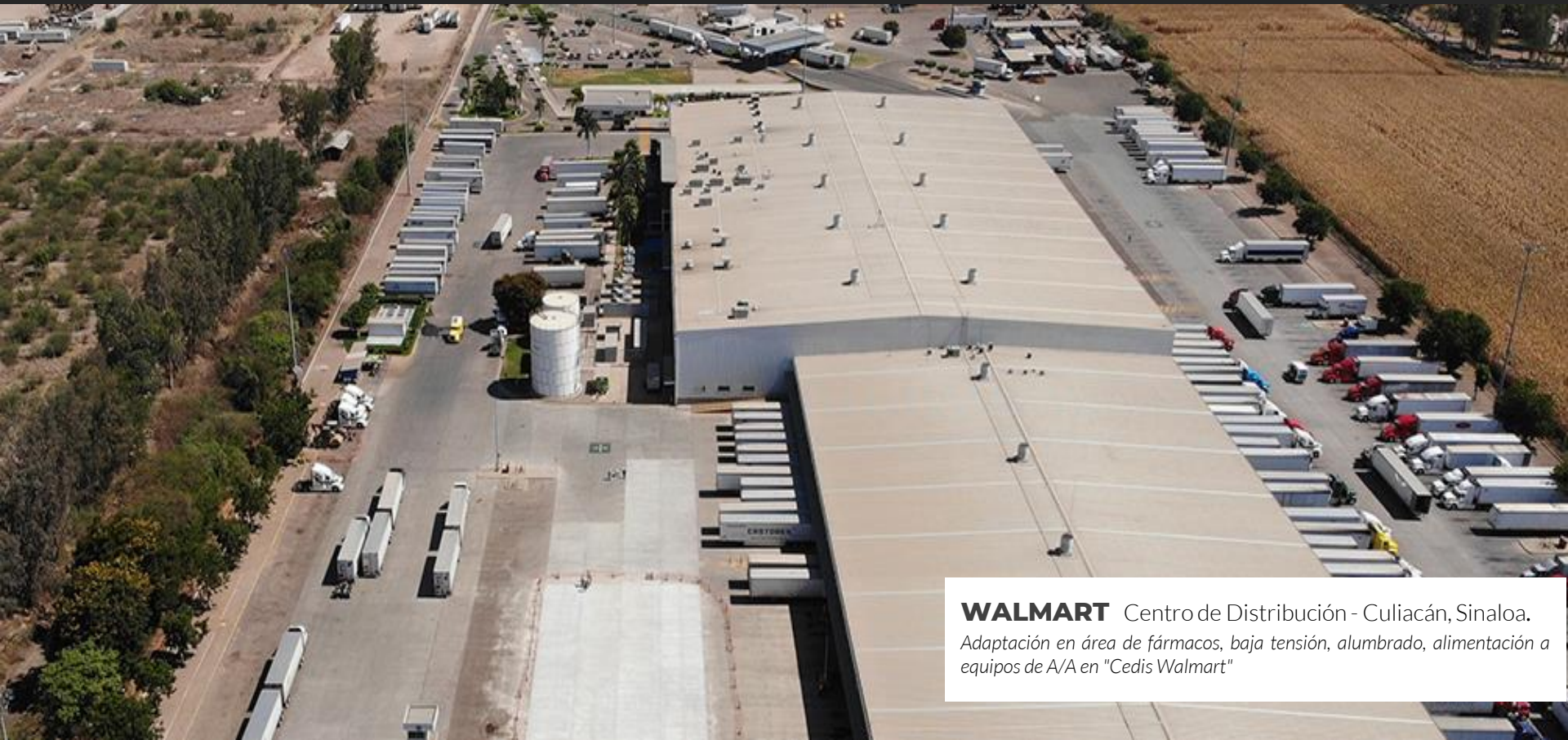
WALMART Centro de Distribución - Culiacán, Sinaloa. Adaptación en área de fármacos, baja tensión, alumbrado, alimentación a equipos de A/A en "Cedis Walmart"