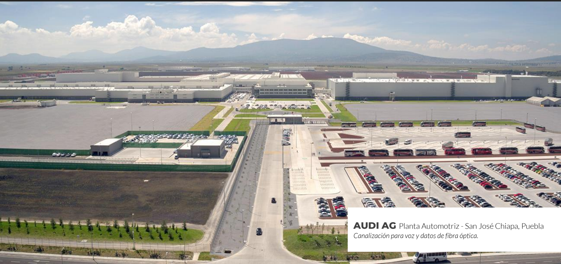
AUDI AG Planta Automotriz - San José Chiapa, Puebla Canalización para voz y datos de fibra óptica.