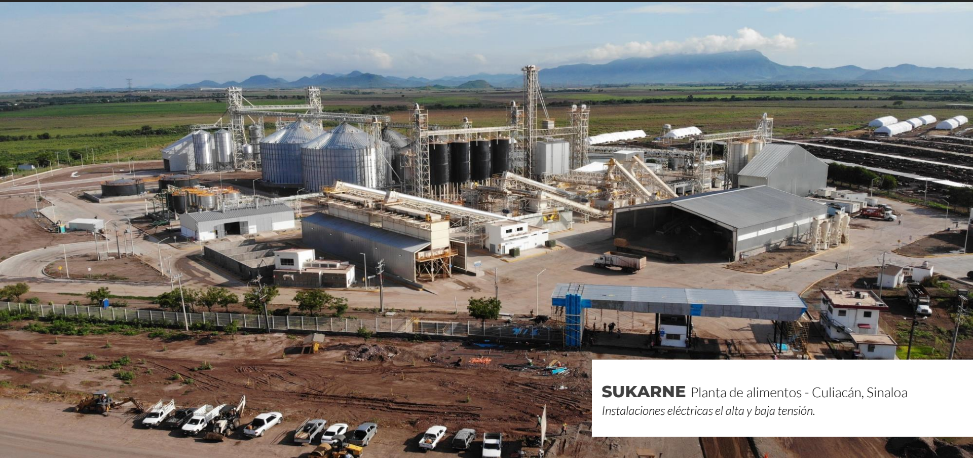
SUKARNE Planta de alimentos - Culiacán, Sinaloa Instalaciones eléctricas el alta y baja tensión.